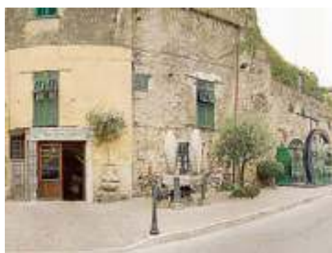
Il frantoio Sommariva di Albenga

Produzione: per posizione e condizioni climatiche il Paese potrebbe diventare uno dei produttori maggiori di olio extra vergine d'oliva di qualità. Trentamila ettari e 5/6 milioni di litri di extra vergine prodotti all'anno. Il potenziale di crescita è notevole. Caratteristiche: sapore fruttato leggero, simile a quello di alcuni prodotti italiani. Qualità: apprezzabile.